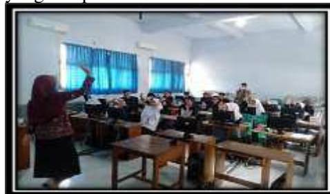
Gambar 4 Antusias Siswa Mengikuti Kegiatan

Kegiatan pengabdian ini diikuti dengan antusias oleh siswa Hal ini terbukti dari banyaknya pertanyaan dan tanggapan yang muncul berkaitan dengan praktek equation & symbol sebagaimana yang ada pada Gambar 4.