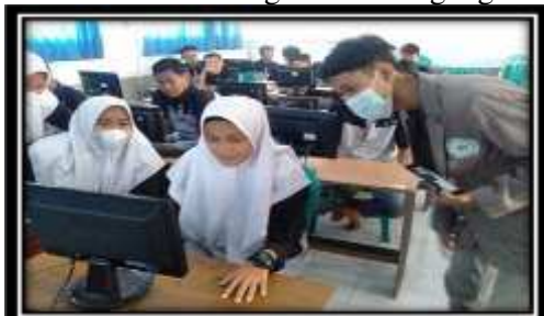
Gambar 2 Pendampingan Kegiatan

Pada saat praktikum, pemateri memberikan contoh kasus yang didalamnya berisi rumus-rumus matematika yang harus dipecahkan oleh siswa. Rumus-rumus matematika tersebut beragam jenisnya dan beragam pula tingkat kesulitannya. Siswa diberikan pendampingan dalam melakukan praktikum oleh pemateri dan anggota tim lainnya. Pendampingan dilakukan individu per individu dan menjawab semua pertanyaan yang muncul dan kesulitan yang dihadapi. Hal ini dilakukan karena pendekatan individu dapat membuat konsentrasi siswa meningkat (Supriadi, 2020). Pemateri juga tak lupa memberikan tips untuk mengetik rumus matematika yang sudah tergolong rumit dengan melihat urutan pada rumus yang diketahui. Gambar 2 menunjukkan pendampingan yang dilakukan selama kegiatan berlangsung.