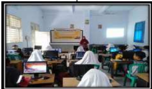
Gambar 1 Pemaparan Materi dan Pendampingan Kegiatan

mengetahui bahwa penulisan rumus-rumus matematika dengan equation & symbol lebih rapi. Di samping itu, siswa mengetahui bahwa matematika itu mempunyai simbol-simbol yang unik. Hal tersebut terlihat pada Gambar 1.