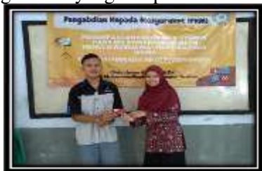
Gambar 5 Simbolis Pemberian Hadiah

Kegiatan diakhiri dengan pemberian hadiah bagi siswa yang bisa mempraktekkan menulis equation & symbol dengan waktu yang paling cepat sebagaimana yang ada pada Gambar 5.